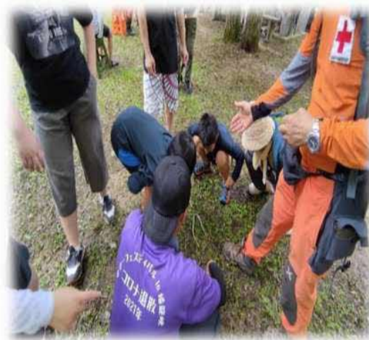
マムシ観察 ↑ 蟠龍峡自然観察 ↓