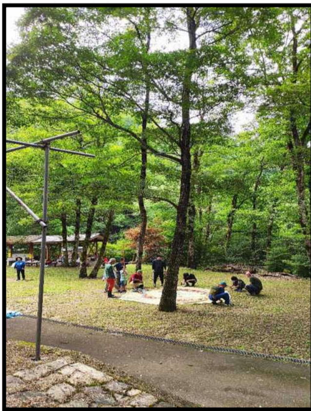
テント設営（男子） テント設営（女子）

令和6年8月20日 発行所 比之宮公民館 〒696-0711 邑智郡美郷町宮内 562-5 電話 0855-82-3474 Fax 0855-82-3800 メールアドレス himenomiya@outlook.com 比之宮の人口 7月現在 ・男114人 ・女120人