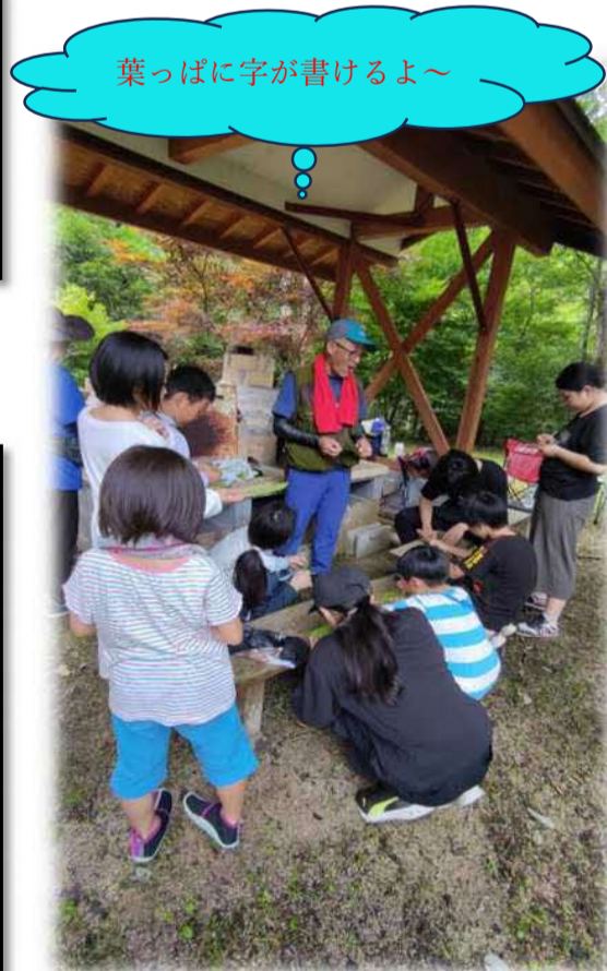
葉っぱに字が書けるよ～