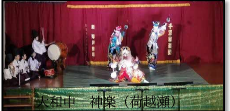
大和申 神楽 (荷越瀬)