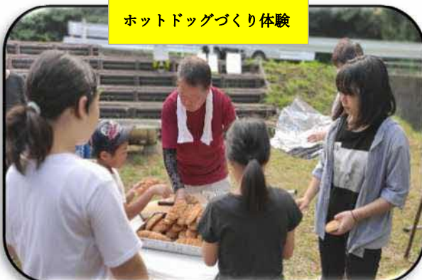
ホットドッグづくり体験