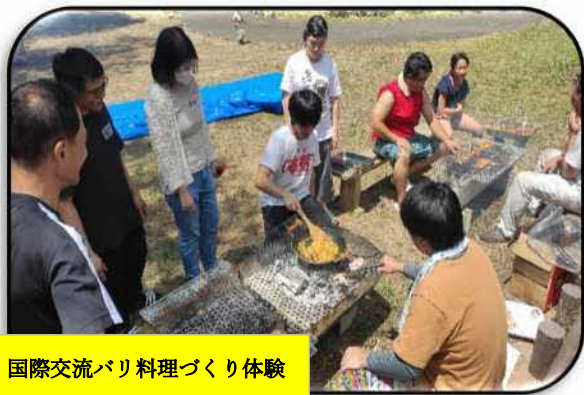
国際交流バリ料理づくり体験