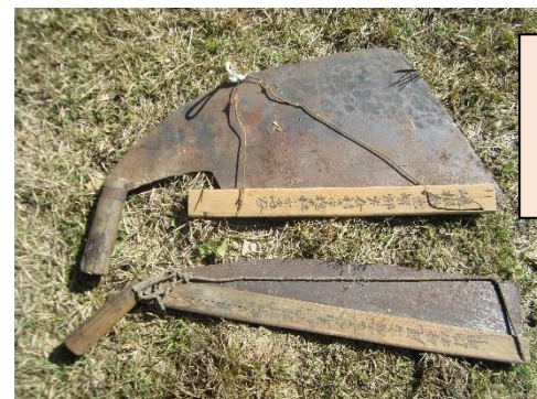
鋸(のこぎり) ☆歯の部分にカバーがしてあります。

君谷・別府地域に眠っている民具の紹介をさせていただいています。明治から昭和前期にかけての暮らしが、見えてくる資料だと思えます。懐かしんだり、子どもたちに使い方を教えてあげたりしてください。