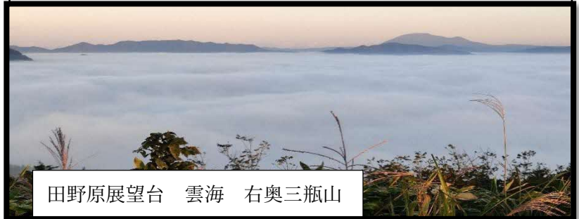
田野原展望台 雲海 右奥三瓶山