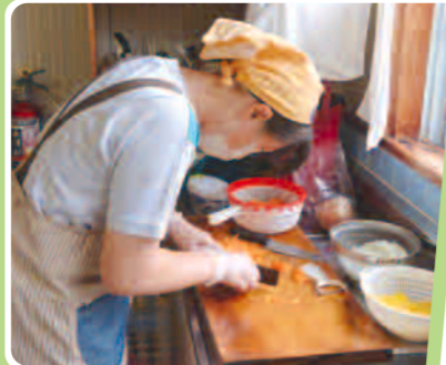
見事な包丁さばき