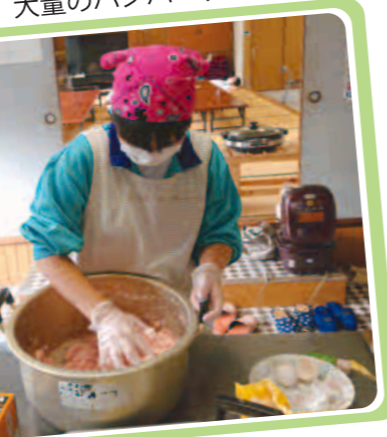
大量のハンバーグ作り