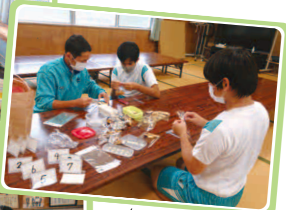
クッキーの袋詰め なんと10分で完売