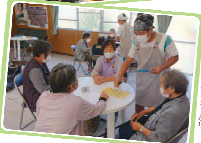
初めてのオーダーとり