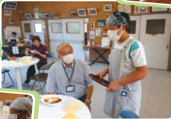
緊張MAX お客さんは校長先生