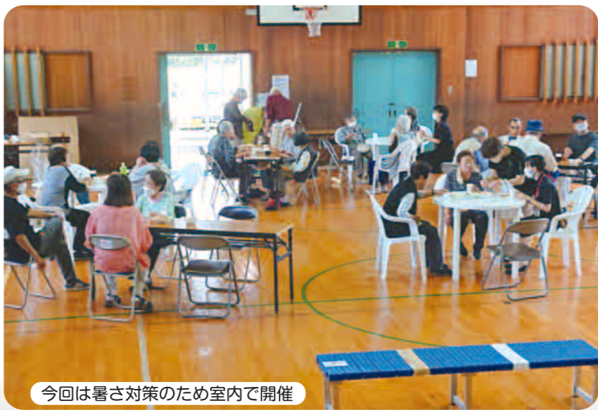
今回は暑さ対策のため室内で開催

特別なことをするわけでもなく、日常の何気ない会話を楽しむ時間、しかし高齢化の進むこの地域では何にも代え難い大切な時間なのだと感じています。