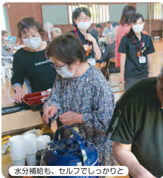
水分補給も、セルフでしっかりと