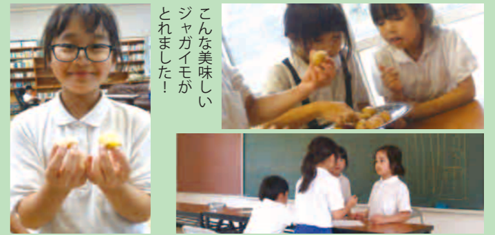
こんな美味しいジャガイモがとれました!