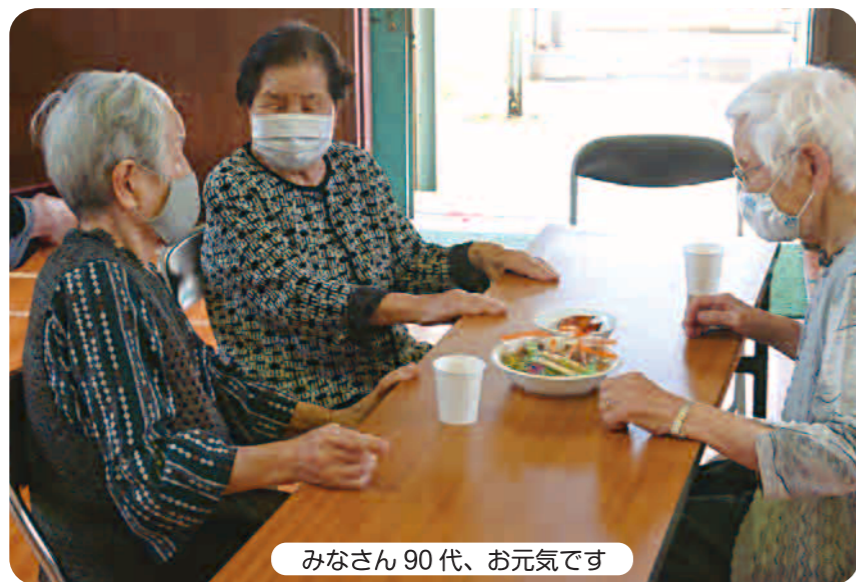
みなさん90代、お元気です